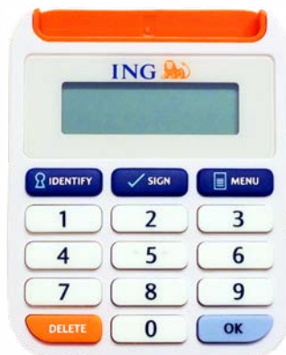
Votre lecteur de carte ING