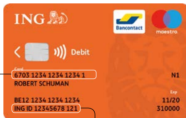
Votre carte de banque ING

Pour installer et activer l'app ING Smart Banking, il faudra vous munir de :